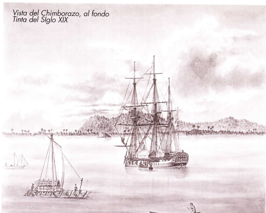
Vista del Chimborazo, al fondo Tinta del Siglo XIX